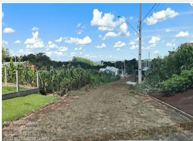
Rua Adelino Severino