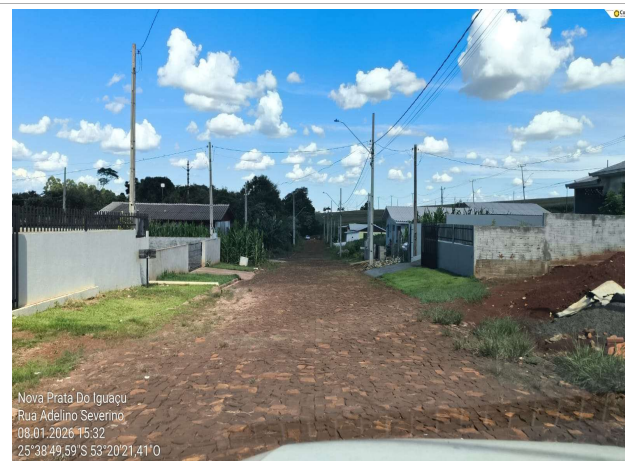
Rua Adelino Severino