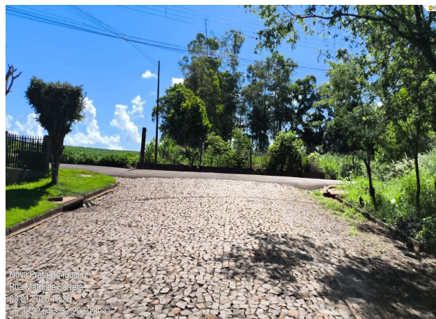
Rua Mathilde Sareta