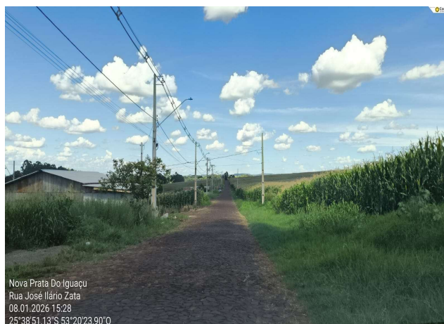
Rua José Ilario Zata