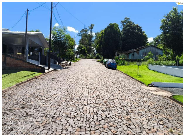
Rua Mathilde Sareta