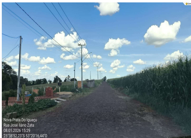
Rua José Ilario Zata